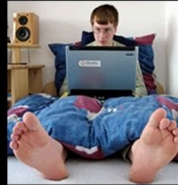
How I really work