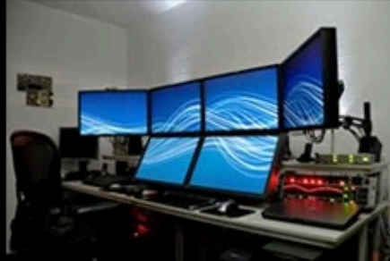
How my clients think I work