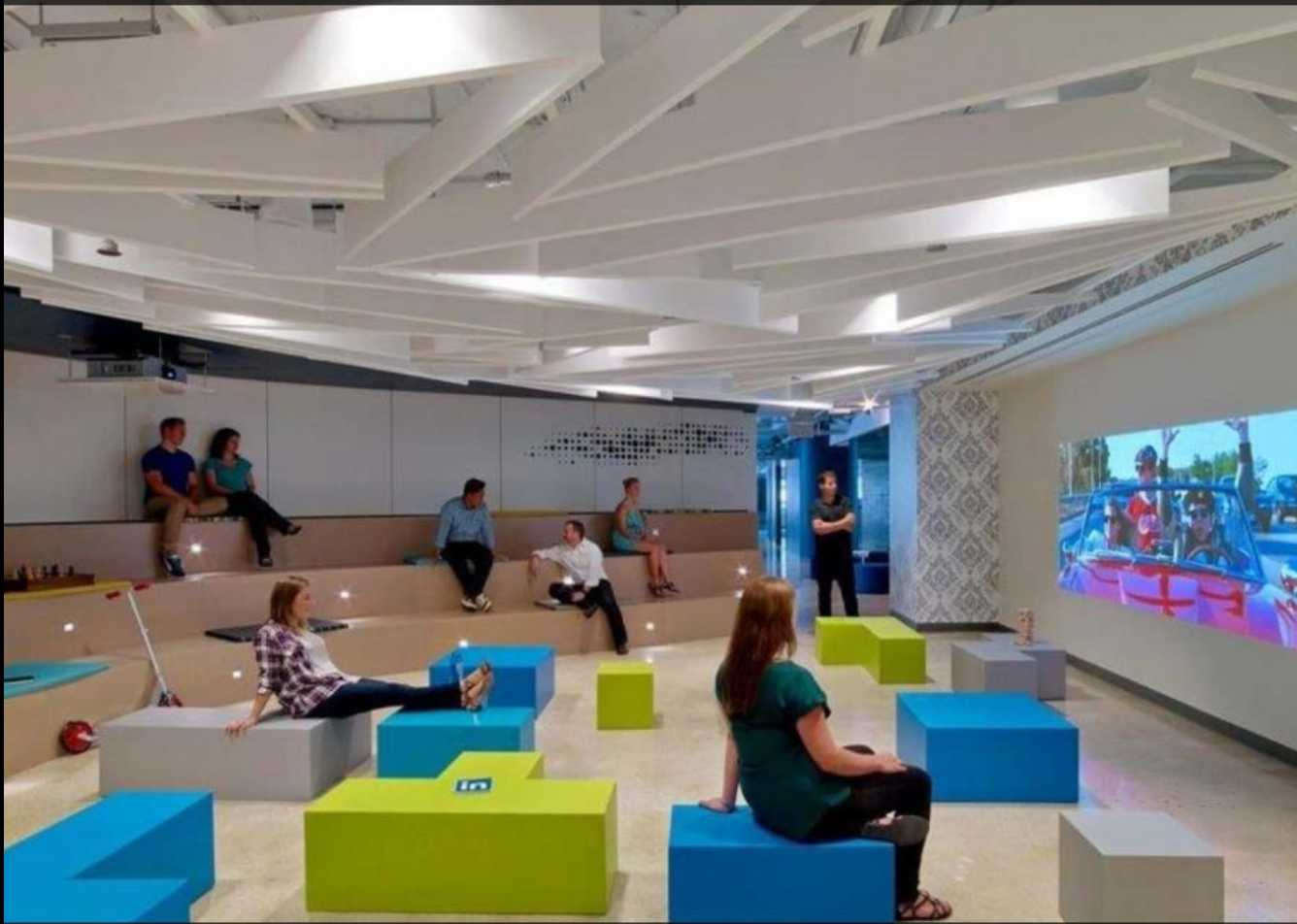
8. LinkedIn