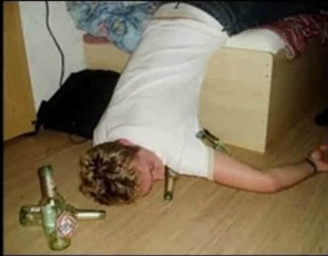
How my colleagues think I work