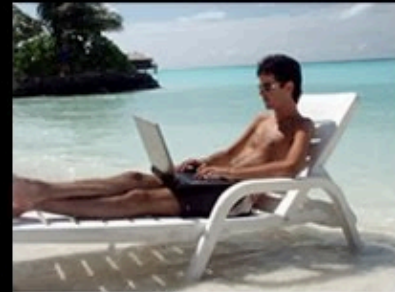
How my friends think I work