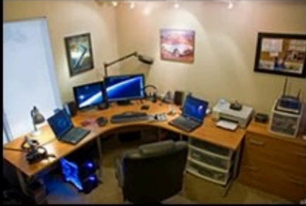
How my boss thinks I work